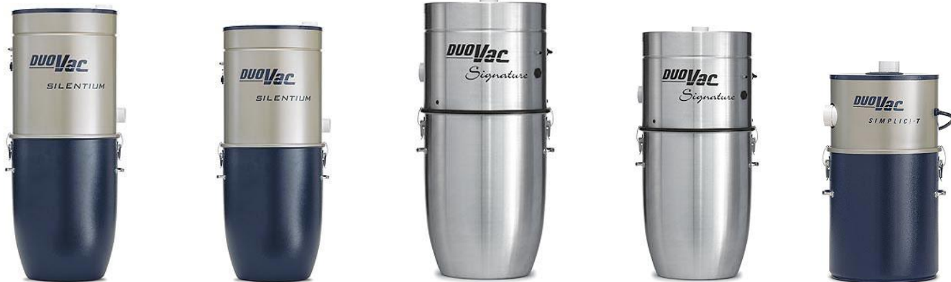
SILENTIUM 660 ES SILENTIUM 523 ES SIGNATURE 874 E-I SIGNATURE 660 E-I SIMPLICI-T 523 E-C